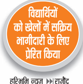
हरिभूमि न्यूज राजौद

राजकीय कालेज में स्पोर्ट्स कमेटी के तत्वावधान में चौथी वार्षिक खेलकूद प्रतियोगिता का आयोजन उत्साहपूर्वक किया। प्रतियोगिता में विद्यार्थियों ने बढ़-चढ़कर भाग लेते खेल प्रतिभा का प्रदर्शन किया। मैदान में जोश, अनुशासन और खेल भावना का संगम देखने को मिला। प्रतियोगिता के अंतर्गत 100, 200 व 400 मीटर दौड़, जैवलिन थ्रो, शॉट पुट, लंबी कूद सहित विभिन्न स्पर्धाएं आयोजित की गईं।