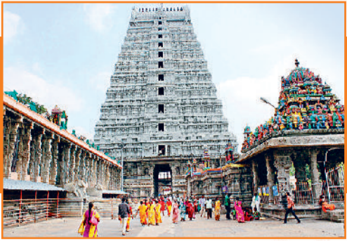
अन्नामलाईयार मंदिर, तिरुवन्नामलाई