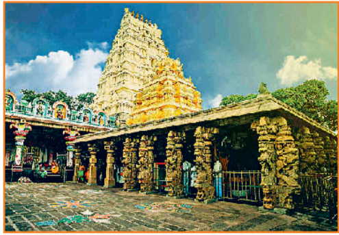
मल्लिकार्जुन स्वामी मंदिर, श्रीशैलम