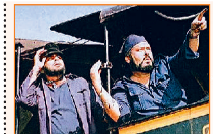
फिल्म 'विधाता' में दिलीप कुमार-शमी कपूर