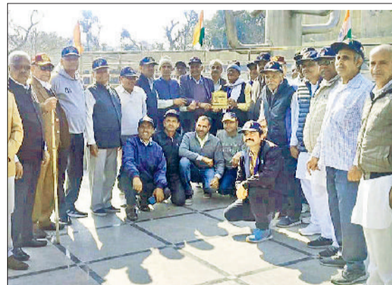
कैथल। शहीदों को श्रद्धांजलि देते पूर्व सैनिक