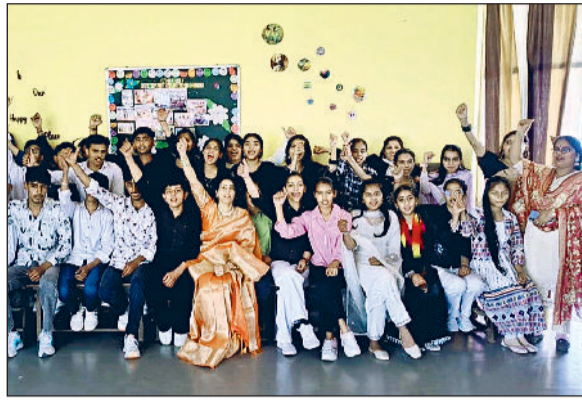
जुलाना। ईडन गार्डन स्कूल में शहीदों के नारे लगाते छात्र।