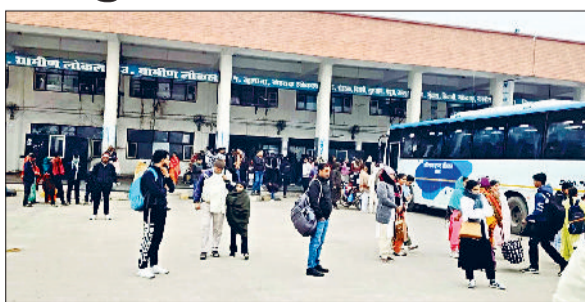
जीद। बस अड्डा पर मौजूद यात्री।

नरवाना से गुरुग्राम के लिए सुबह सात बजकर 50 मिनट पर एसी बस शुरू की गई है। एसी बस में नरवाना से गुरुग्राम का किराया 330 रुपये है। जबकि साधारण रोडवेज बस में किराया 215 रुपये है। नरवाना से गुरुग्राम की दूरी 204 किलोमीटर है।