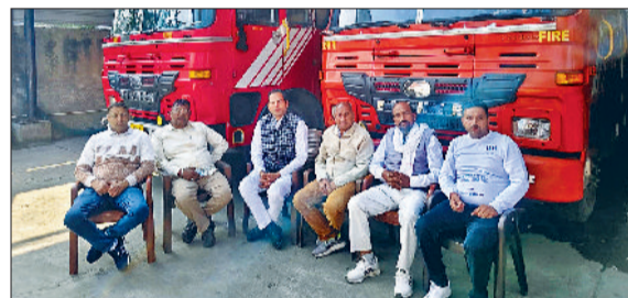
कैथल। दमकल कार्यालय में विचार विमर्श करते कर्मचारी नेता।

प्रयोग है। जिसका दंश आज लाखों सेवानिवृत्त कर्मचारी झेल रहे हैं। प्रदेश महासंघिय रिषी नेन व प्रदेश शासन-प्रशासन की नीतियों को इमानदारी से लागू करता है। इसके विपरीत एनपीएस और यूपीएस में न तो पेंशन की गारंटी है और न ही बुढ़ापे की कोई सुनिश्चित सुरक्षा। समिति ने कहा कि शंकर बाजार पर