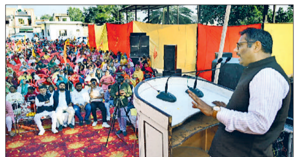
कैथल। हिंदू सम्मेलन को संबोधित करते पदाधिकारी।