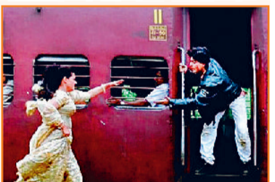
'दिलवाले दुल्हनिया ले जाएंगे' का क्लासिक सीन