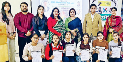
जीद। नियुक्ति पत्र के साथ छात्राएं।