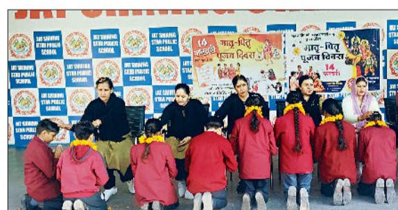
कैथल। जाट शाइनिंग स्टार स्कूल में अपनी माताओं का पूजन करती छात्राएं।

रवाना होती है। एसी बस में जीद से चंडीगढ़ का किराया 340 रुपये, जीद से गुरुग्राम का किराया 251 रुपये लगता है। जीद डिपो में लगभग 170 साधारण बसें हैं। पहले डिपो में एसी बस नहीं थी। जीद से चंडीगढ़, दिल्ली, गुरुग्राम के अलावा हरिद्वार, रिषिकेश, देहरादून, पांचवी साहिब, सालासर, बालाजी, अमृतसर और लुधियाना रूटों पर भी साधारण बसें ही जा रही हैं।