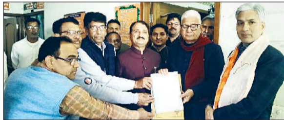
जीद। ज्ञापन सौंपते हुए संघ पदाधिकारी।