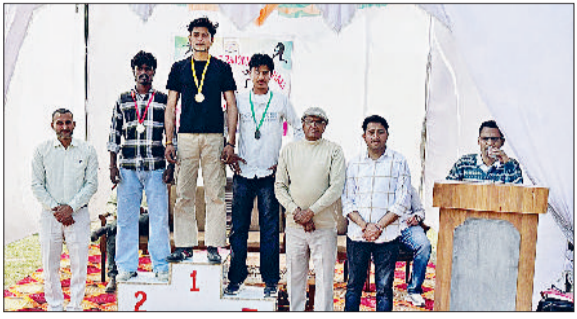
राजौद। विजेता खिलाड़ियों को सम्मानित करते।

राजकीय कालेज में स्पोर्ट्स कमेटी के तत्वावधान में चौथी वार्षिक खेलकूद प्रतियोगिता का आयोजन उत्साहपूर्वक किया। प्रतियोगिता में विद्यार्थियों ने बढ़-चढ़कर भाग लेते खेल प्रतिभा का प्रदर्शन किया। मैदान में जोश, अनुशासन और खेल भावना का संगम देखने को मिला। प्रतियोगिता के अंतर्गत 100, 200 व 400 मीटर दौड़, जैवलिन थ्रो, शॉट पुट, लंबी कूद सहित विभिन्न स्पर्धाएं आयोजित की गईं।