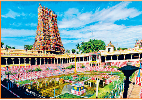
मीनाक्षी सुंदरेश्वरार मंदिर, मदुरै