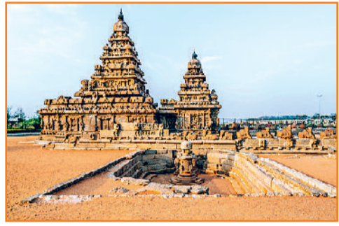
तट मंदिर, महाबलीपुरम

तट मंदिर, महाबलीपुरम तमिलनाडु: तट मंदिर दक्षिण भारत के सबसे पुराने संरचनात्मक मंदिरों में से एक है। यह परिसर बंगाल की खाड़ी के तट पर तमिलनाडु के महाबलीपुरम में समुद्र के किनारे स्थित है। इसे अपनी द्रविड़ वास्तुकला और ऐतिहासिक महत्व के लिए जाना जाता है। इस मंदिर का