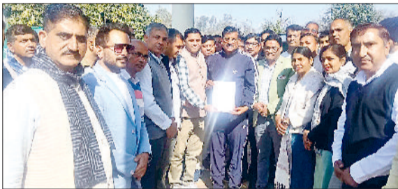
जींद। कैबिनेट मंत्री को झापन सौपाते हुए।