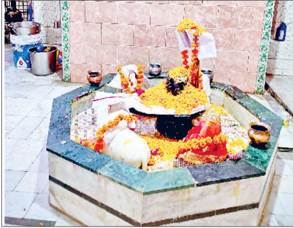
महाशिवरात्रि पर्व को लेकर जयंती देवी मंदिर में शिवलिंग पर किया गया श्रृंगार।